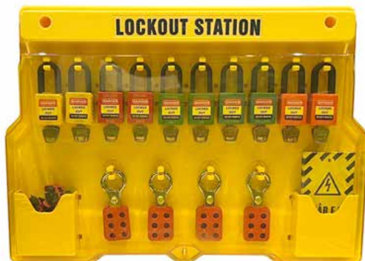
E-nr: E0668726 Art.nr: X3098701