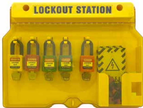
E-nr: E0668724 Art.nr: X3099191